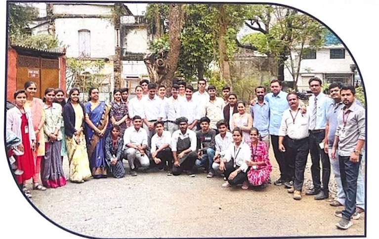
बि.एस.सी. हॉस्पिटॅलिटी रायसोनी महाविद्यालयातील विद्यार्थी पुंडलिक प्रशासकीय महाविद्यालयाला अभ्यास भेट