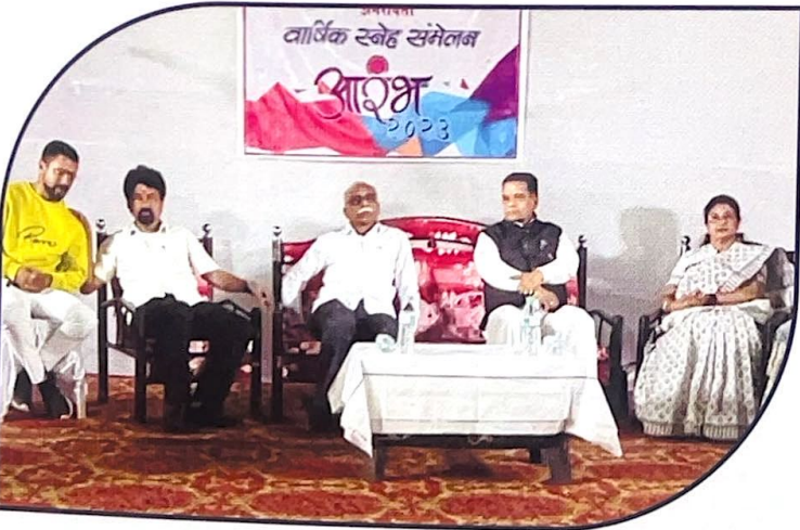
पुंडलिक प्रशासकीय महाविद्यालयात वार्षिक स्नेह संमेलन ला उपस्थित मान्यवर