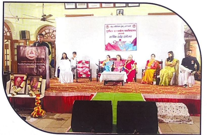
व्यवसायसंबंधी मार्गदर्शन करताना मान्यवर