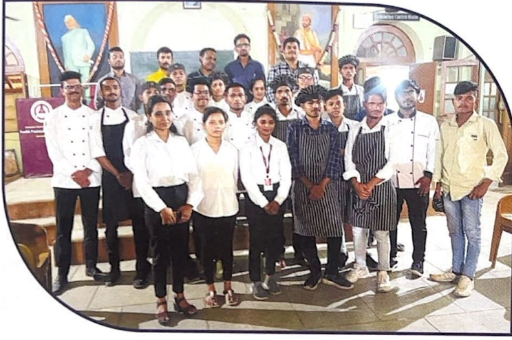
रायसोनी बि.एस.सी. हॉस्पिटॅलिटीचे महाविद्यालयातील विद्यार्थी पुंडलिक प्रशासकीय महाविद्यालयात प्रात्यक्षिक करीत असतांना