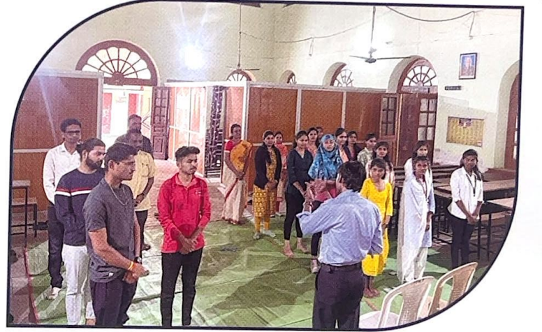
योगा मार्गदर्शन सेमिनार