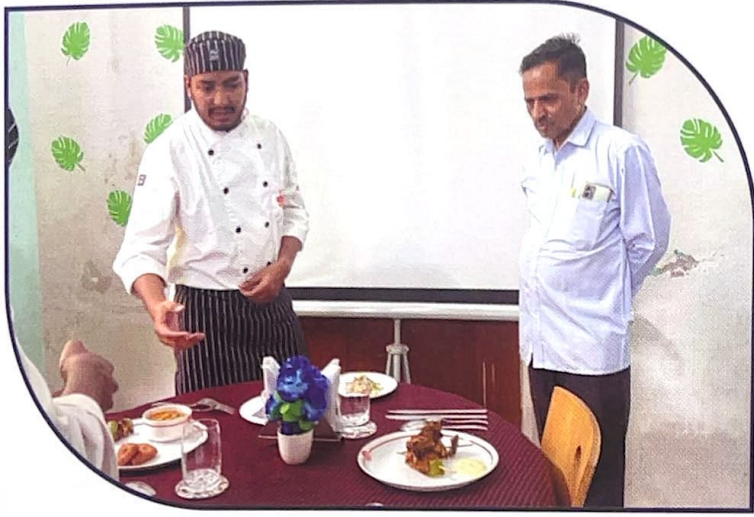
बि.एस.सी. हॉस्पिटॅलिटीच्या विद्यार्थ्यांनी बनविले मेनुचे परीक्षण